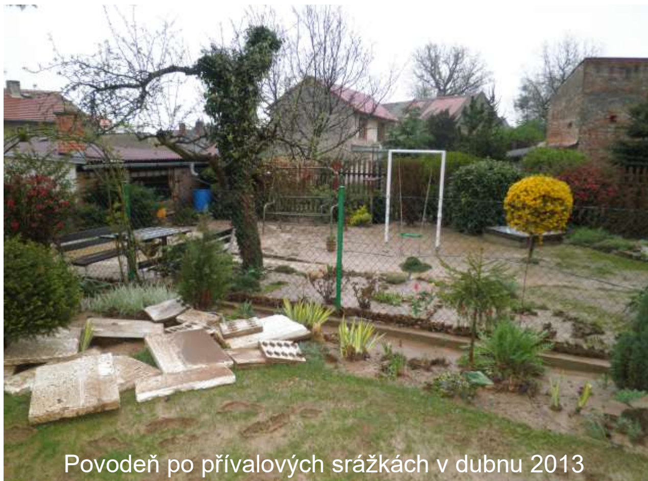
Povodeň po přívalových srážkách v dubnu 2013