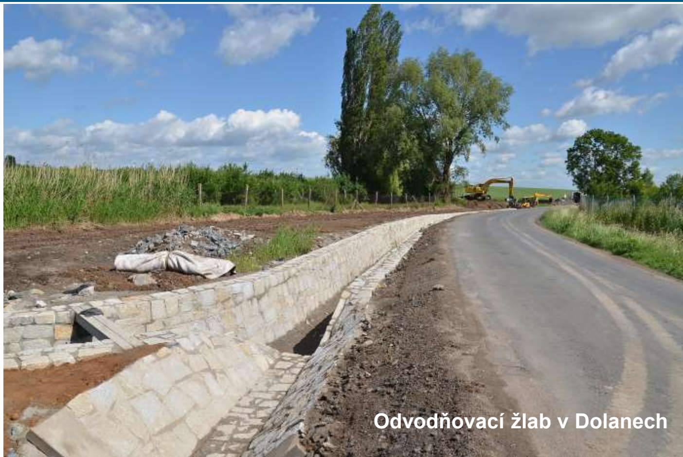
Odvodňovací žlab v Dolanech