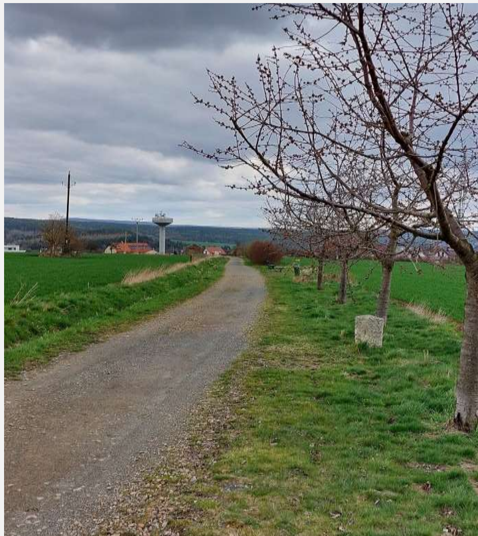
Polní cesta Nouzov NC 1