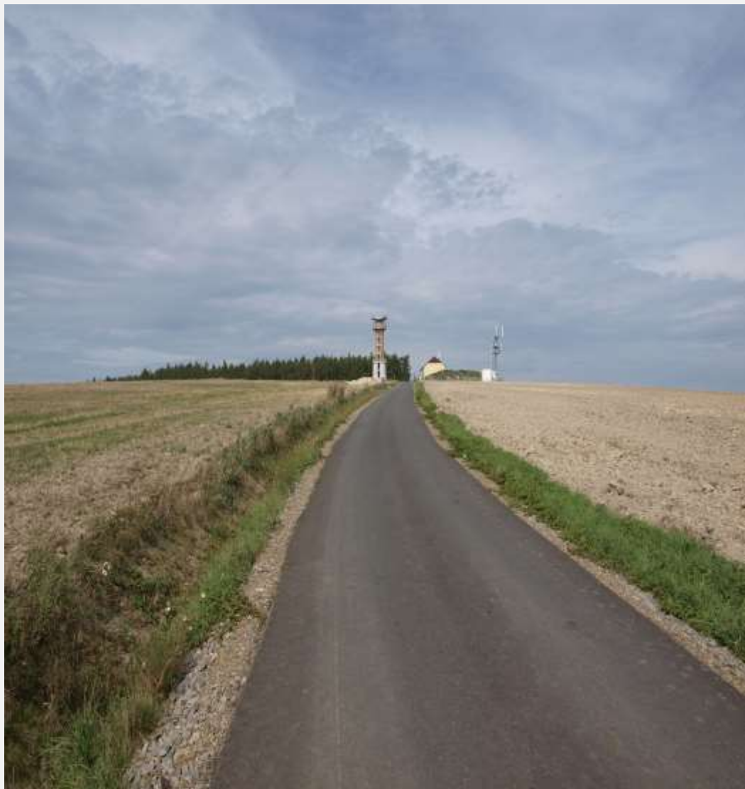
Polní cesta HPC 18 k.ú. Pavlíkov