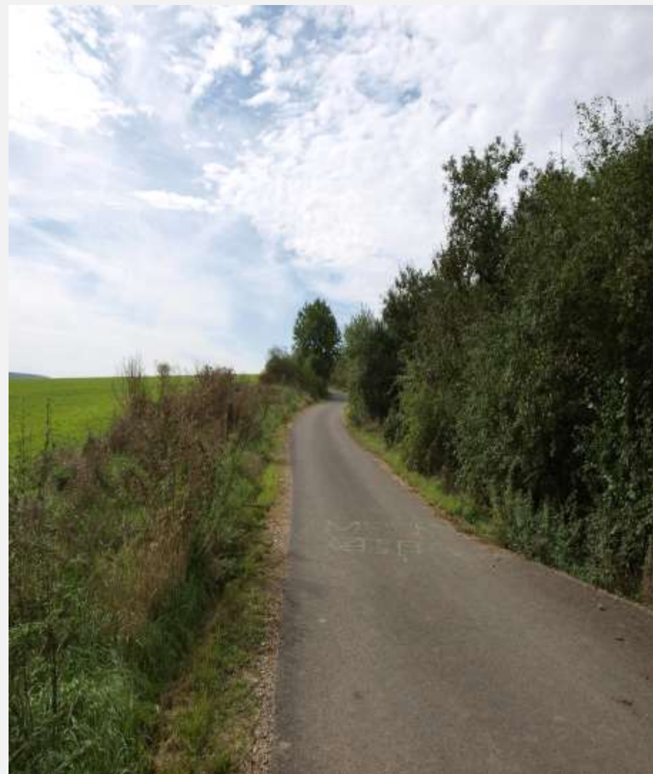
Polní cesta C 30 k.ú. Senomaty