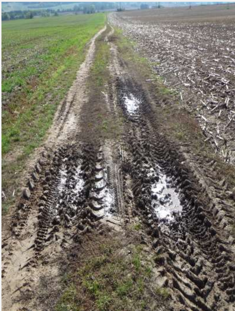
Polní cesta C 40 k.ú. Senomaty