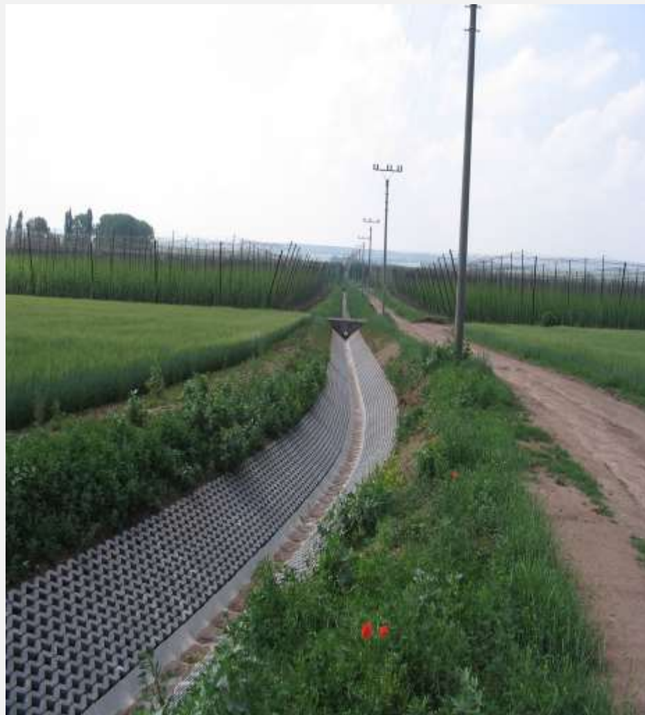
Suchý poldr k.ú. Kněževes